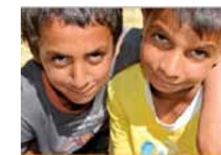
La Protection des Enfants migrants dans une Zone de Libre Circulation

- La communication des résultats et des recommandations de la recherche : une conférence internationale intitulée « Vers une réponse unifiée pour la protection des enfants victimes de la traite des êtres humains et d'exploitation en Europe? », a été organisée à Budapest en décembre 2012 afin d'encourager l'harmonisation des réponses nationales et européennes sur la protection des mineurs migrants européens. La conférence a réuni des magistrats, des spécialistes de la lutte contre la traite des êtres humains, de la protection de l'enfance et d'autres professionnels de plusieurs pays européens.